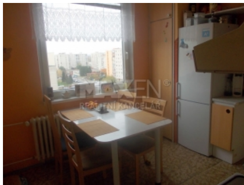
Byt 3+1+L + sklep